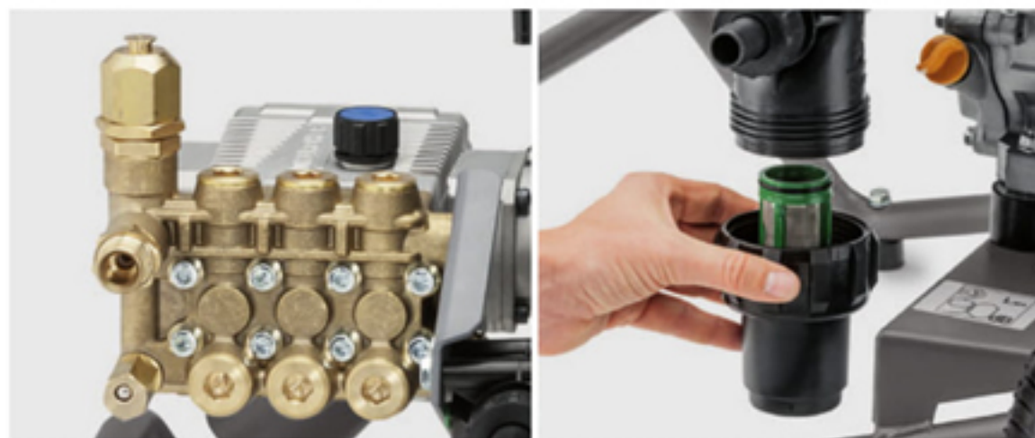
耐久性・パワーのあるクランクシャフトポンプを採用。ゴミ詰まりの故障リスクを低減するための大容量フィルター。(HD 6/12 G, HD 6/15 G)