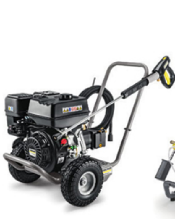
3. HD 7/20 G Classic (エンジンモデル)