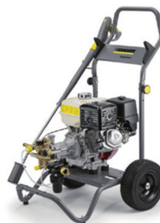
5. HD 9/23 G (エンジンモデル)