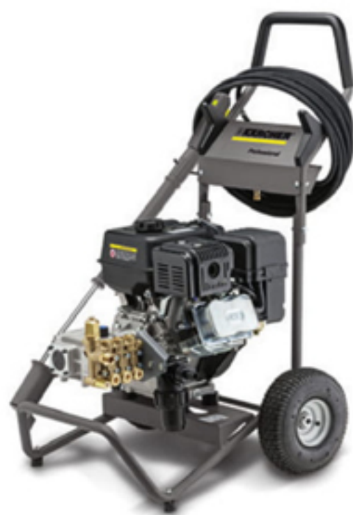
2. HD 6/15 G (エンジンモデル)