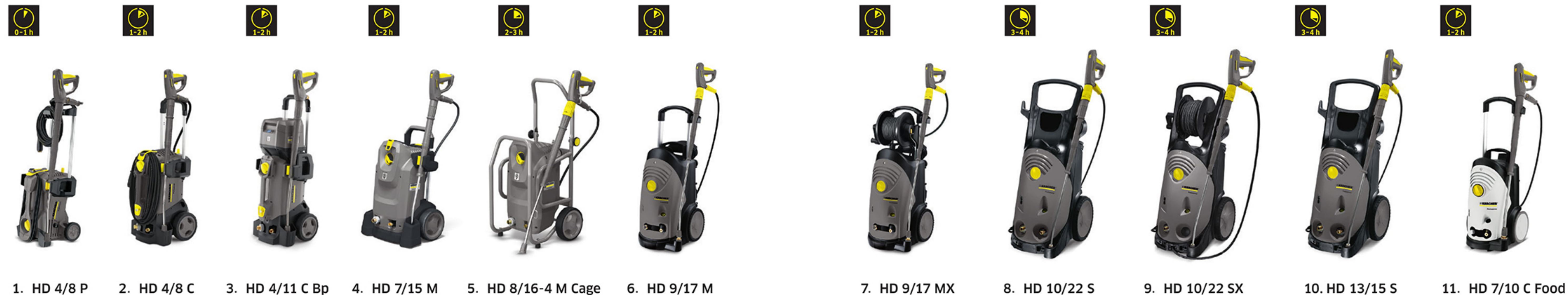
1. HD 4/8 P 2. HD 4/8 C 3. HD 4/11 C Bp (コードレス) 4. HD 7/15 M 5. HD 8/16-4 M Cage 6. HD 9/17 M 7. HD 9/17 MX 8. HD 10/22 S 9. HD 10/22 SX 10. HD 13/15 S 11. HD 7/10 C Food

洗浄剤切替システム 背面に洗浄剤ボトルを2つ装着可能。スイッチで2種類の洗浄剤を使い分けできます。機械を止めずに切り替えが可能です。 □ 対象製品 HD 9/17 M、MX