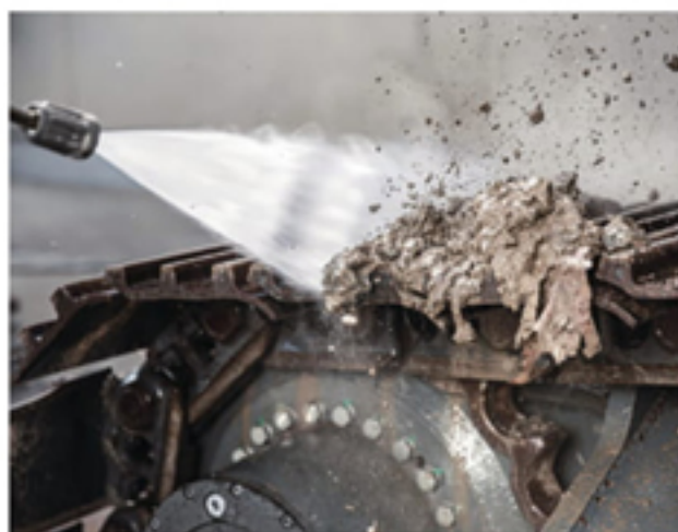
重機や資材にこびりついた頑固な汚れもパワフルに洗浄するハイパワー仕様です。