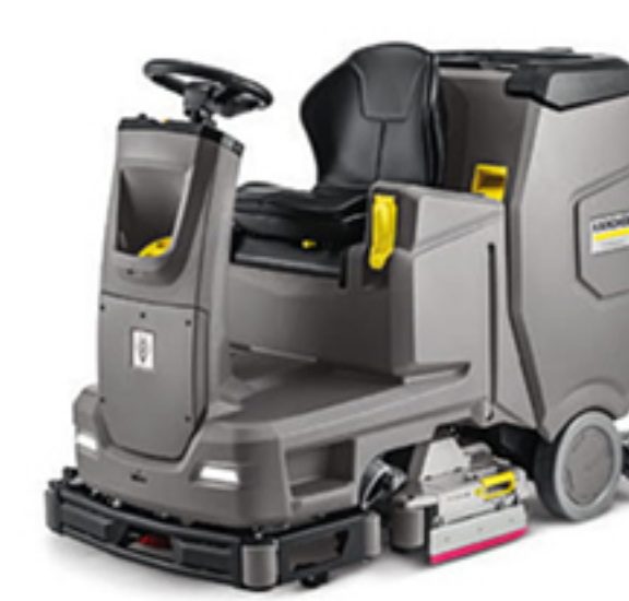
10. B 110 R Bp +R75+DOSE 11. B 110 R Bp +D75 (写真はローラーブラシモデル)