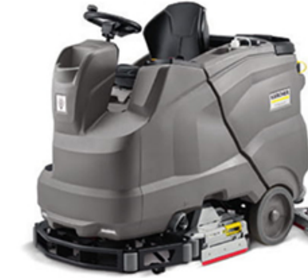
12. B 150 R Bp +R85+DOSE+Rins 13. B 150 R Bp +D90+DOSE+Rins (写真はローラーブラシモデル)