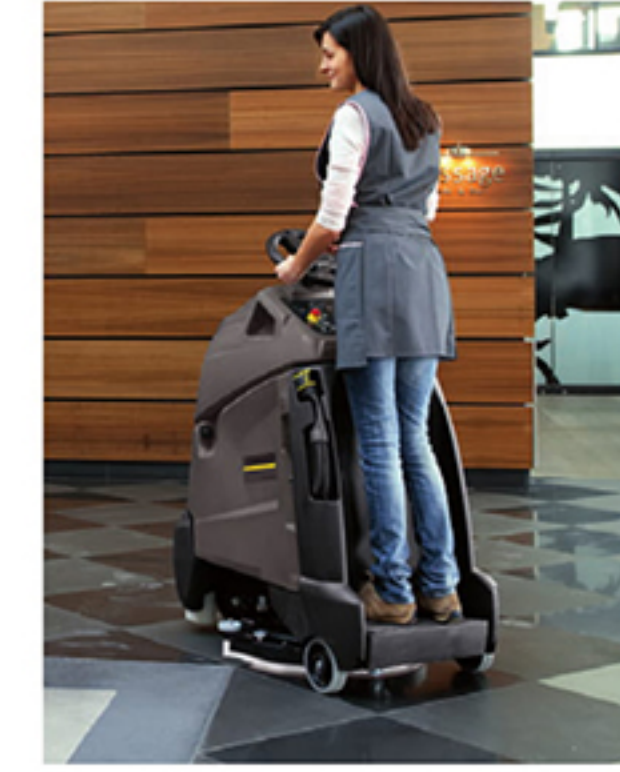
BD 50/40 RS Bp