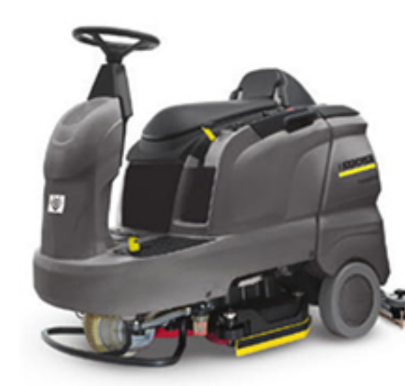
7. BR・BD 55/90 R Classic Bp 8. BR・BD 65/90 R Classic Bp 9. BR・BD 75/90 R Classic Bp (写真はディスクブラシモデル)