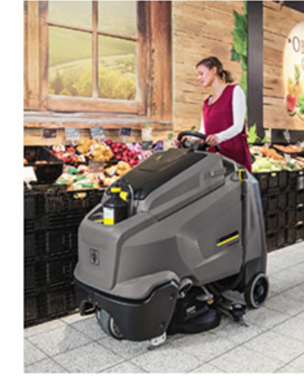
BR 65/95 RS Bp DOSE