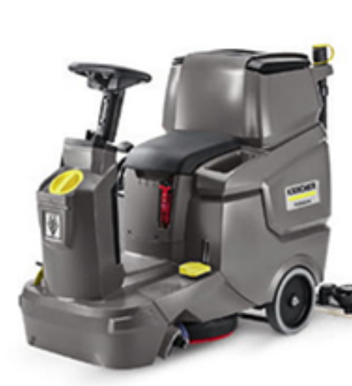
6. BD 50/70 R Bp