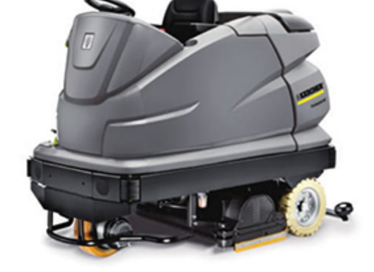
14. BR 120/250 R Bp DOSE