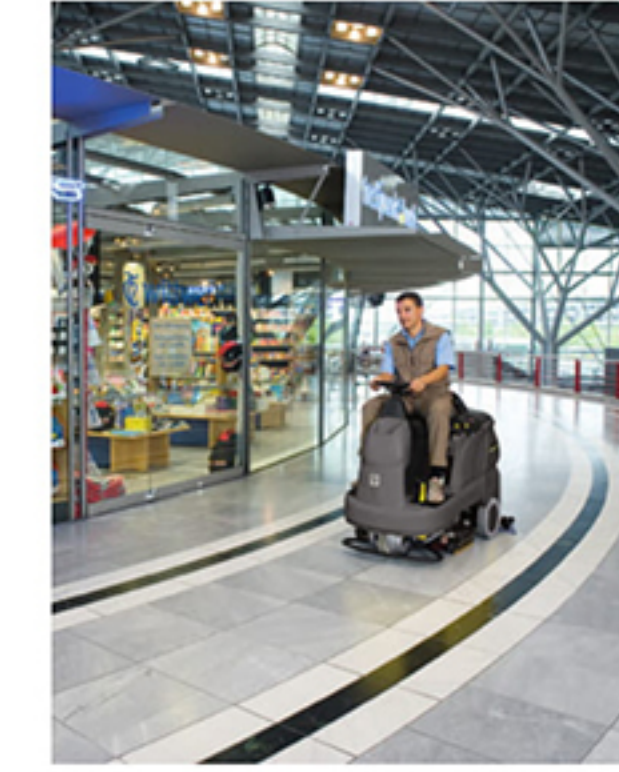
BR 55/90 R Classic Bp