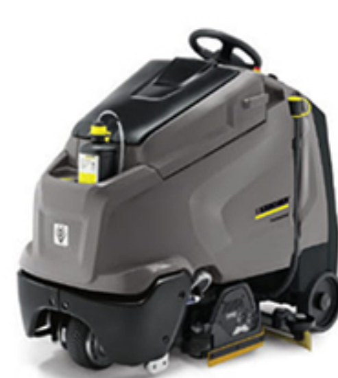
3. BD 65/95 RS Bp DOSE 4. BR 65/95 RS Bp DOSE 5. BR 75/95 RS Bp DOSE (写真はローラーブラシモデル)