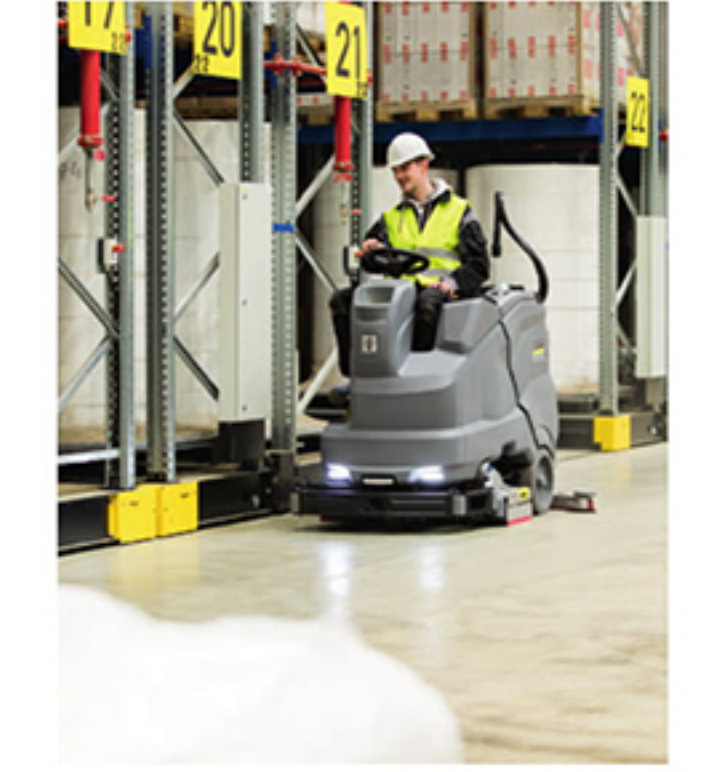
B 150 R Bp +R85+DOSE+Rins