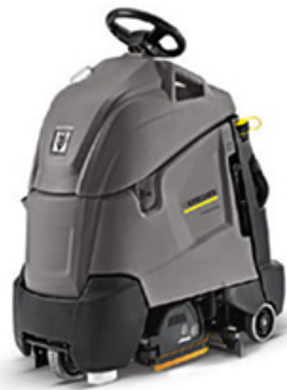
1. BR 55/40 RS Bp 2. BD 50/40 RS Bp (写真はローラーブラシモデル)