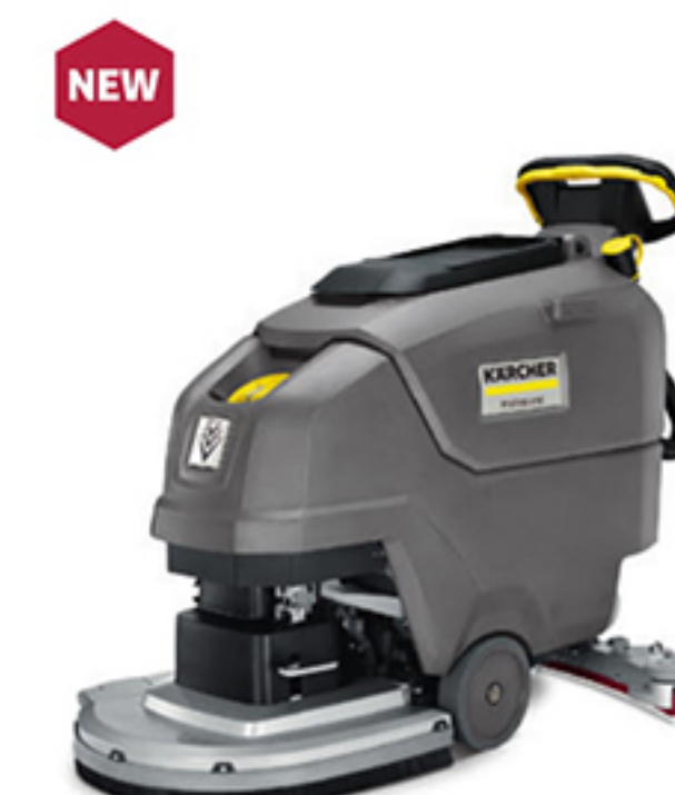
NEW 5. BD 50/55 W Classic Bp (20インチ)