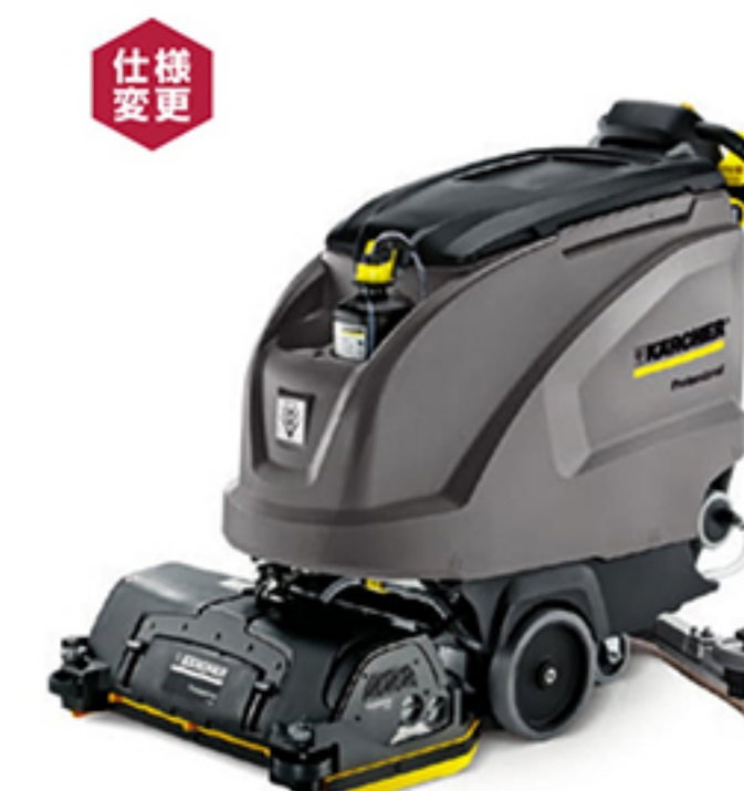
仕様変更 6. BR 55/60 W Bp DOSE 7. BR 65/60 W Bp DOSE