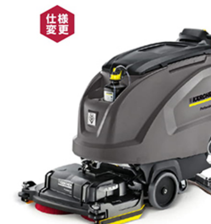
仕様変更 8. BD 55/60 W Bp DOSE 9. BD 65/60 W Bp DOSE