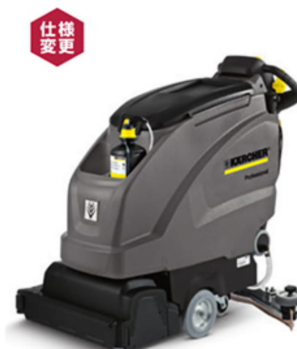
仕様変更 2. BR 55/40 W Bp (写真はプレミアムモデル)