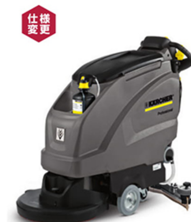
仕様変更 4. BD 51/40 W Bp (20インチ) (写真はプレミアムモデル)