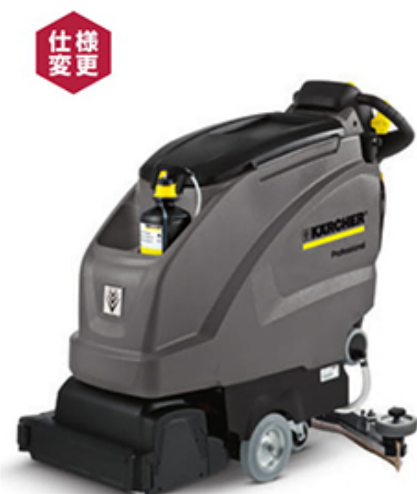
仕様変更 1. BR 45/40 W Bp (写真はプレミアムモデル)

鍵管理システム【KIK (キック)】 鍵で清掃内容を管理することで誤設定による事故やコスト増を防止。 ※KIK:ケルヒャー・インテリジェント・キー 対象機種：Classicモデル以外