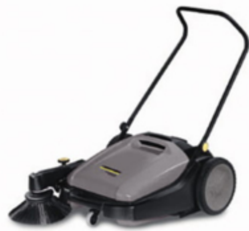
1. KM 70/20 C