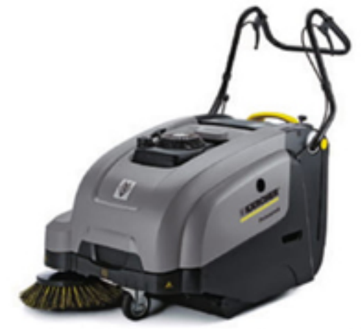
写真は KM 75/40 W G