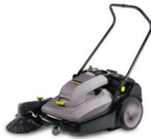
2. KM 70/30 C Bp