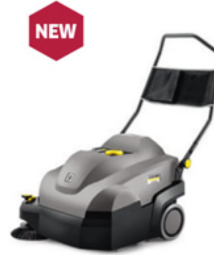
3. CVS 65/1 Bp